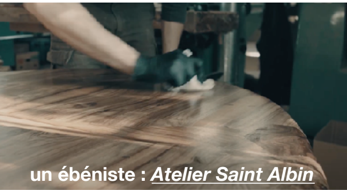
un ébéniste : Atelier Saint Albin