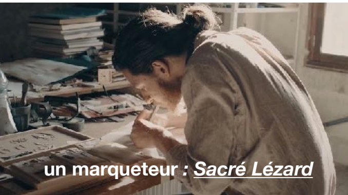
un marqueteur : Sacré Lézard

Sept artisans se sont installés depuis Septembre 2021