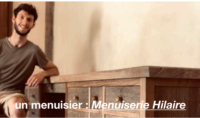
un menuisier : Menuiserie Hilaire